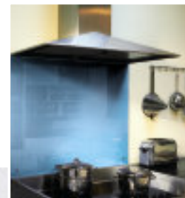
◀ Pareti di rivestimento protettivo per cucine Soft Blue ref 1435 - versione SAFE