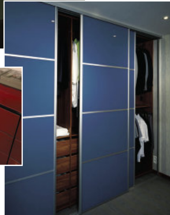
▲ Ante per armadi Ocean Ref 1227 - versione SAFE