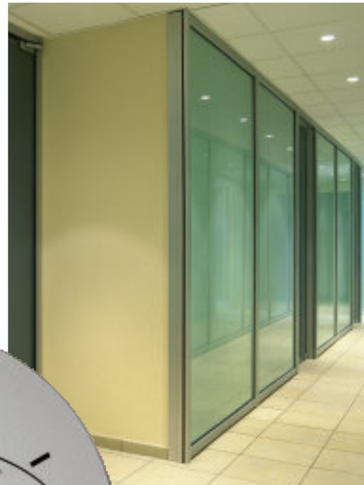
▲ Divisori per pareti ufficio Orchard Ref 1604 - versione SAFE