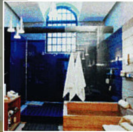
▲ Rivestimento per bagni (pareti interne delle cabine doccia) Marine- RAL 5002 - versione SAFE