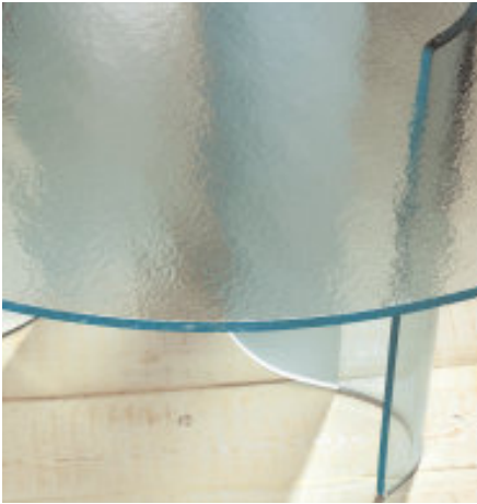
1 - Dalcobel - applicazione: tavolo