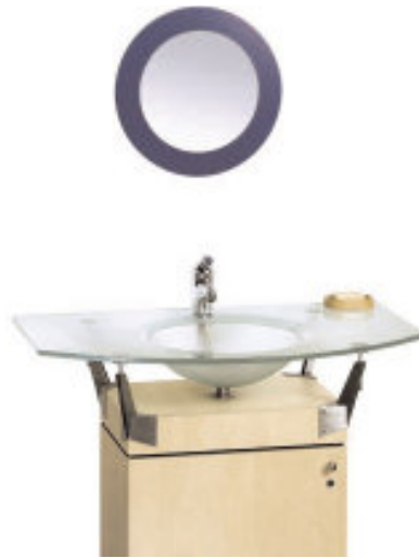
2 - Galette - applicazione: lavabo

Galette e Dalcobel sono vetri stampati. Il primo ha un disegno geometrico in rilievo, mentre l'altro ha un aspetto estetico simile al granito. Entrambi hanno un look decisamente moderno, in linea con la crescente domanda di vetri in forte spessore per numerose applicazioni.